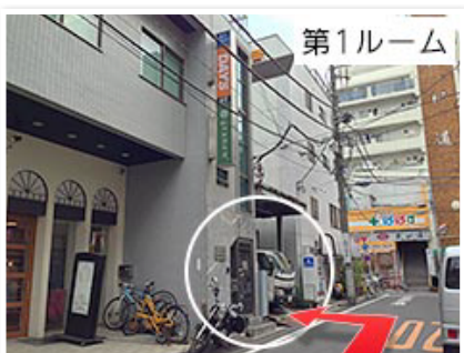
(4)第1ルームは印刷工場のとおり、 老人ホームの向かい側です。