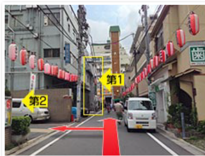
(3)歯科を左折すると第2ルーム。 第1ルームへはそのまま直進して下さい。