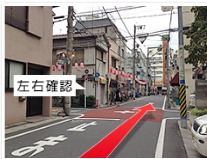
(2)交差点を越えて直進。