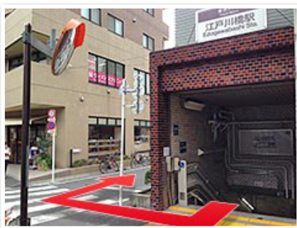
(1)江戸川橋駅4番出口を右折。