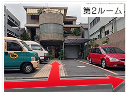
(5)駐車場は第2ルーム前にございますので、 来社時にご連絡ください。